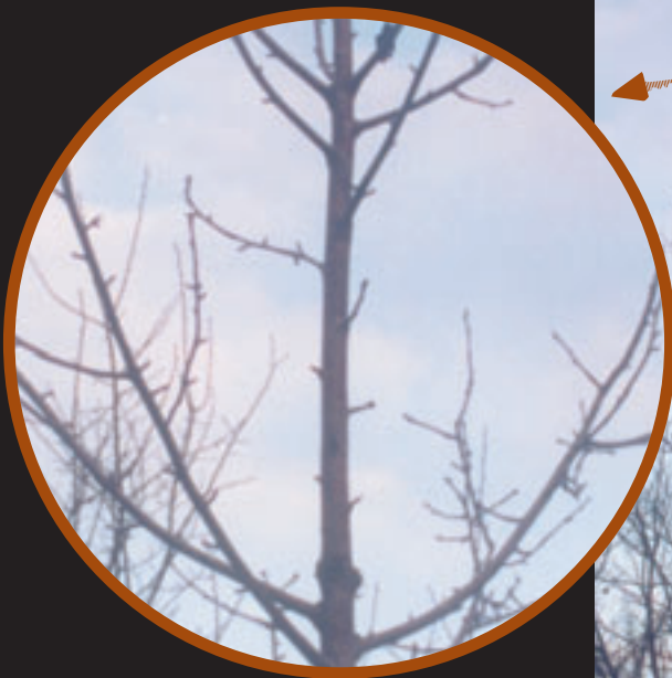
Formazio mozketak edo baso-mozketak. Cortes o tallas de formación.